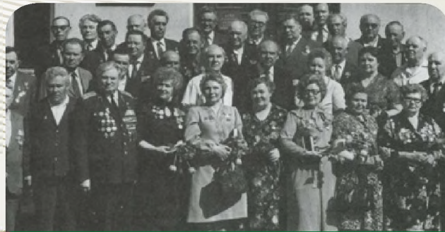
Встреча ветеранов Великой Отечественной войны – работников профсоюзов. 1985 г.