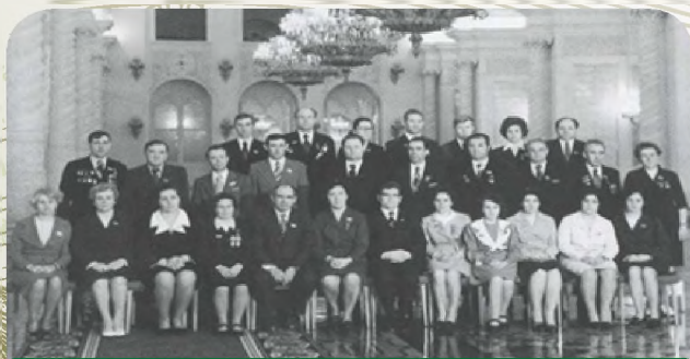
Делегация профсоюзов Пензенской области на XVI съезде профсоюзов СССР, 1977 г.

В результате распада Советского Союза в 1991 году и последовавших «безумных» ре-