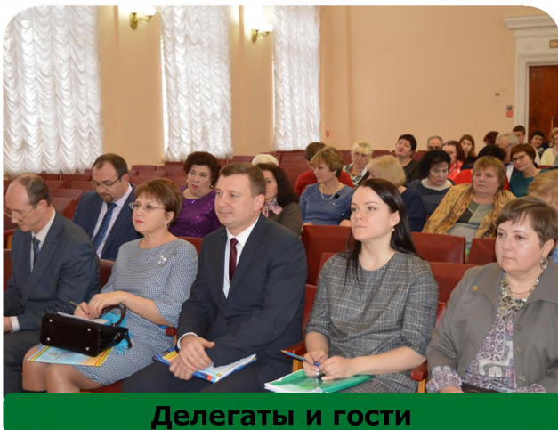
Делегаты и гости

Вместе с тем многие проблемы остаются нерешенными: это низкая рентабельность производства ряда сельскохозяйственных предприятий, закредитованность сельхозтоваропроизводителей, недостаточный