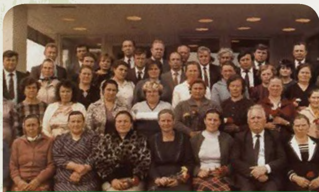
Слет работников сельского хозяйства Пензенской области, 1990 г.

форм агропромышленный комплекс претерпел катастрофическое разрушение, ущерб от которого не сравним даже с ущербом, понесенным во время Великой Отечественной войны. В 1994 году впервые за 30 лет сельское хозяйство области оказалось убыточным, отрасль оставалась нерентабельной до 2002 года. Эти негативные процессы сказались и на деятельности областного комитета Профсоюза. Если в 1990 году в области насчитывалось 1065 первичных профсоюзных организаций с общей численностью членов Профсоюза 255 тыс. человек, то на 01.01.2019 г. осталось 76 профсоюзных организаций с численностью 9390 членов Профсоюза. Несмотря на эти трудности, областная организация Профсоюза сохранила структуру, выстояла и доказала свою работоспособность в защите прав и интересов рабочих и служащих отрасли.