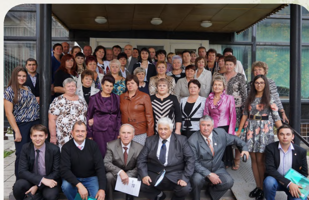
Отчетно-выборная конференция, 2015 г.

Перед областной организацией Профсоюза стоят совершенно новые задачи, потребовалось освоение новых методов работы. Проводятся пикеты, демонстрации, митинги и другие коллективные действия. Возникла необходимость усилить юридическую работу в Профсоюзе, поднять правовую гра-